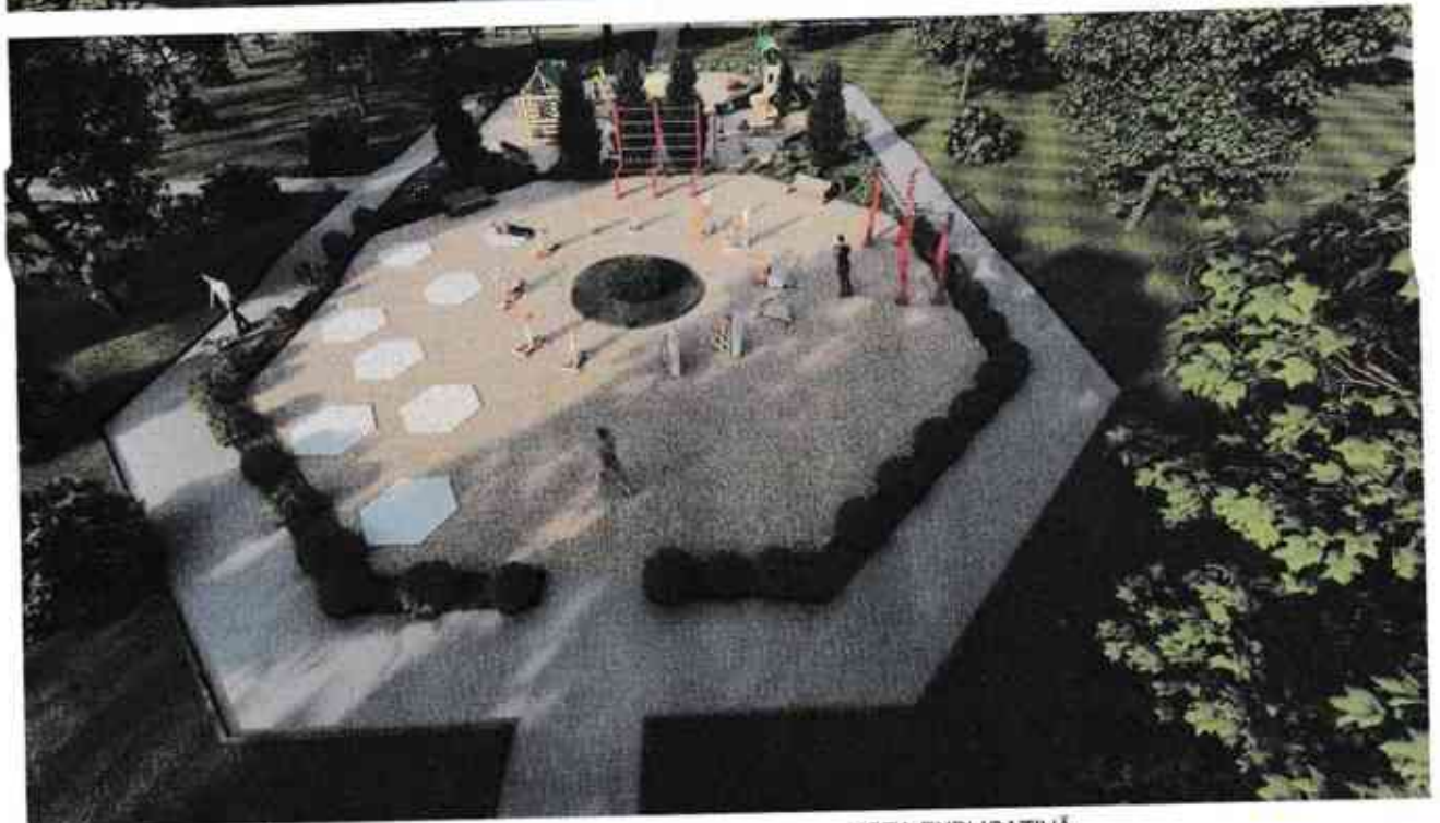
Pavela din cauciuc