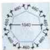
Acoperire teren de fitness